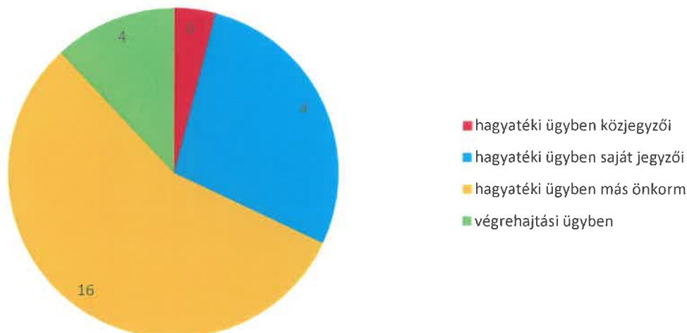
Adó- és értékbizonyítvány 2025 évben

Forrás: Vámosújfalú Községi Önkormányzat adónyilvántartás